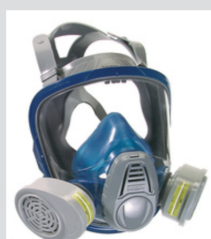
Bảo vệ đường hô hấp - Mặt nạ