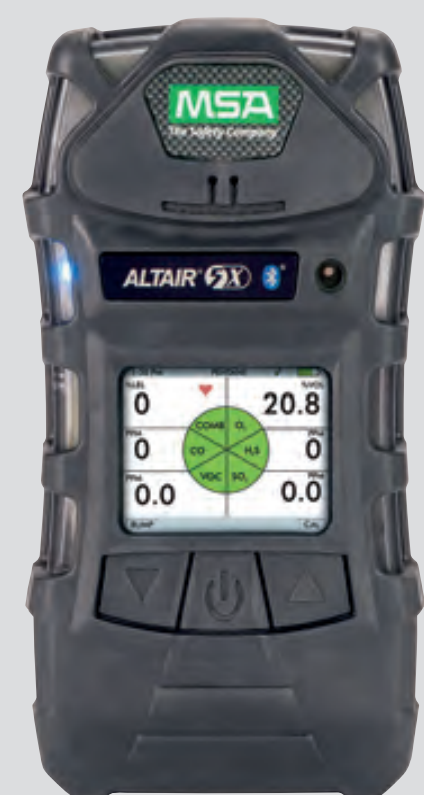
Máy o khí ALTAIR