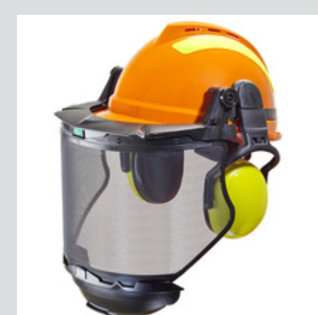
Bảo hộ lao động - Đầu, mặt, mắt, tai