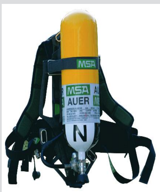
B o v ã ng h o h p - Bình th o