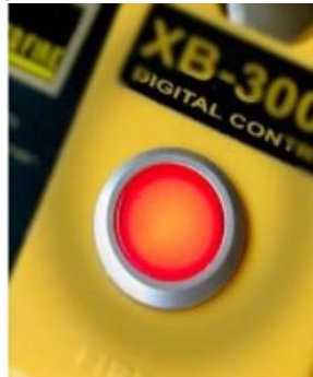
Đèn cảnh báo và sạc đầy