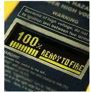
Màn hình hiển thị OLED cao cấp