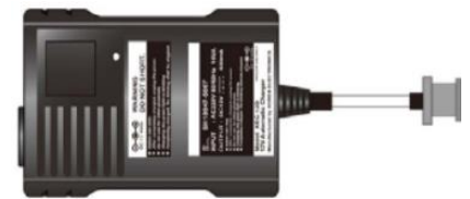
Bộ sạc pin tự động XBC-12D