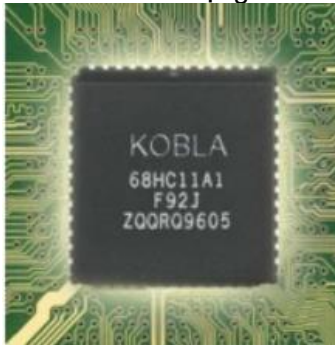
Bộ vin xử lý cao cấp