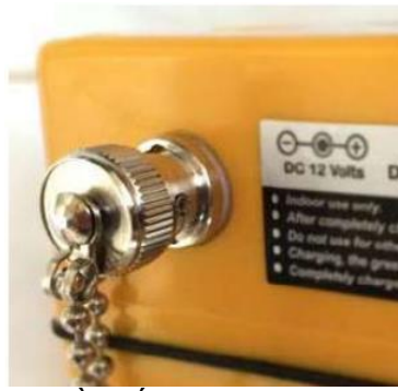
Nguồn cấp cho máy pin sạc