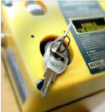
Chìa khóa khởi động an toàn